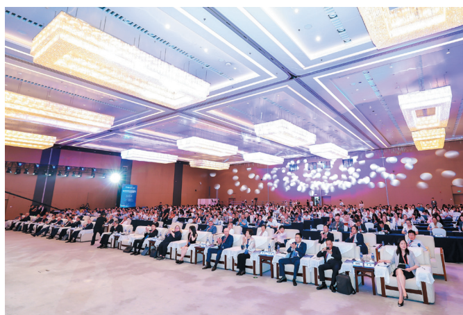
На юбилейное заседание Ассоциации собралось более 1000 участников

Участники подвели итоги работы Ассоциации за предыдущие годы, а также определили наиболее перспективные направления для дальнейшего развития Ассоци-