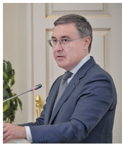
Валерий Фальков, министр науки и высшего образования РФ

Отдельный важный сегмент образования – подготовка среднего медицинского персонала. Чтобы повысить ее качество, необходимы совместные действия университетов и учреждений среднего специального образования. По словам министра, принято решение за каждым вузом закрепить медицинский колледж для методического сопровождения и совершенствования подготовки среднего медицинского персонала.