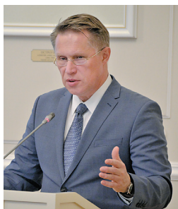
Михаил Мурашко, министр здравоохранения РФ

Приводим ключевые слова и цитаты главных действующих лиц.