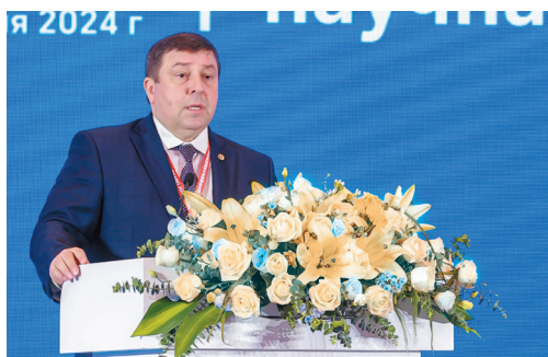
Ректор Первого МГМУ Петр Глыбочко выступил на заседании Совета с важными предложениями