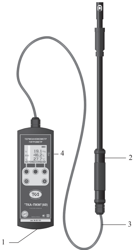
Рис.1 – Внешний вид прибора “TKA-ПКМ”(60)